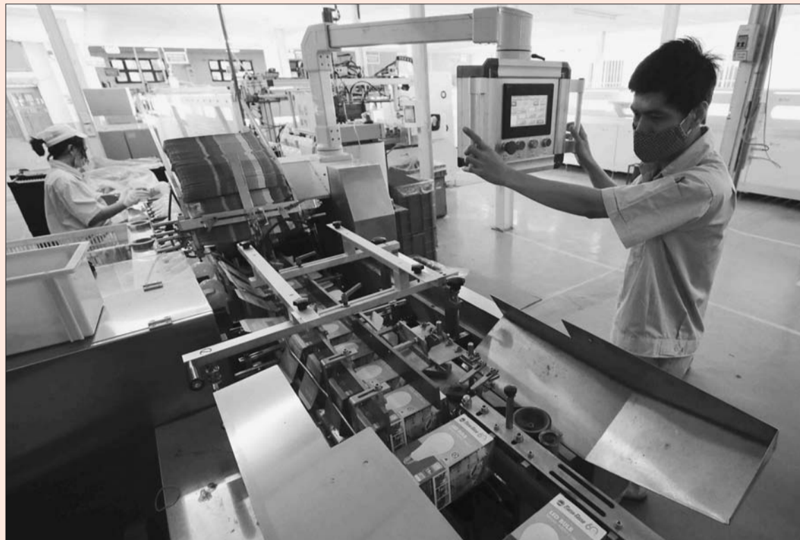
Giải bài toán vốn là một trong những yêu cầu cấp thiết hiện nay để DN có thể phục hồi và phát triển sản xuất, kinh doanh Ảnh tư liệu

Đợt bùng phát dịch Covid-19 lần thứ tư kéo dài khiến nguồn vốn của phần lớn DN đều bị cạn kiệt. Do đó, giải bài toán vốn là một trong những yêu cầu cấp thiết hiện nay để DN có thể phục hồi và phát triển sản xuất, kinh doanh khi mở cửa trở lại nền kinh tế.