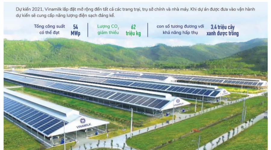
Năng lượng tái tạo được Vinamilk triển khai sử dụng trên quy mô lớn tại các trang trại bò sữa trên cả nước

Chiến lược cũng như hành động cụ thể về phát triển bền vững đã được thể hiện rất rõ qua Báo cáo Phát triển bền vững được Vinamilk công bố hằng năm. Liên tục từ năm 2012, các hoạt động