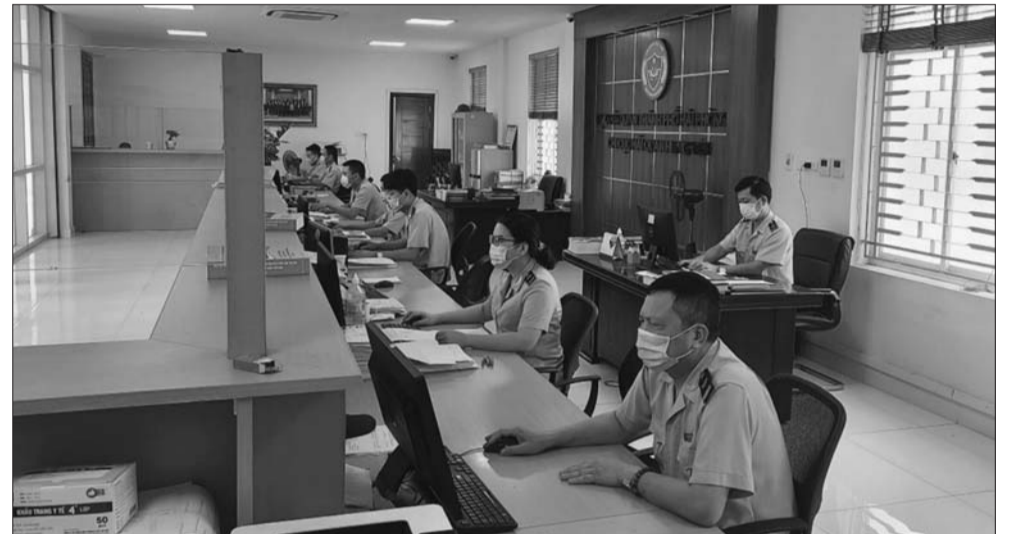
Tổng cục Hải quan đã và đang triển khai đồng bộ nhiều giải pháp để nâng cao năng lực cán bộ công chức

Tiếp nối những kết quả tích cực về cải cách, hiện đại hóa nguồn nhân lực, Tổng cục Hải quan đã xây