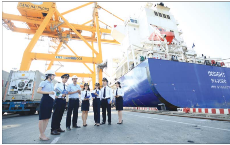
KTNN đã và đang không ngừng hoàn thiện cơ cấu tổ chức bộ máy xứng tầm nhiệm vụ

Đề đảm bảo thực hiện có hiệu quả nhiệm vụ của KTNN được hiến định trong Hiến pháp năm 2013, cũng như những quy định tại Luật KTNN (năm 2015) và Luật Sửa đổi, bổ sung một số điều của Luật KTNN (năm 2019), KTNN đã và đang không ngừng hoàn thiện cơ cấu tổ chức bộ máy cho tương xứng với tầm vóc và vị thế của một thiết chế hoạt động độc lập, chỉ tuân theo pháp luật.