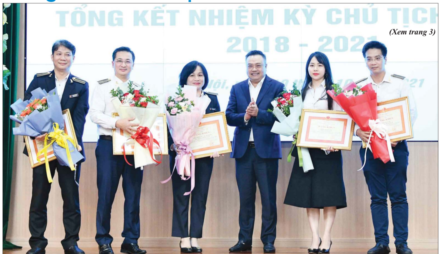
(Xem trang 3)