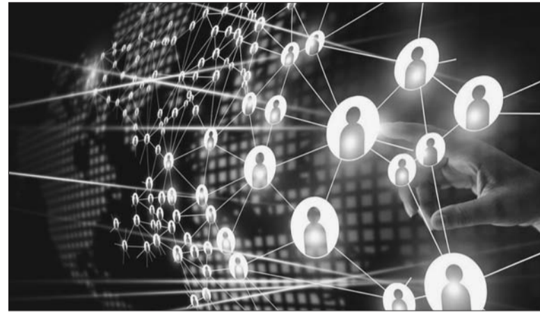
Định hướng của Nhà nước cần đi đôi với sự năng động, hiệu quả của thị trường để chuyển đổi số mang lại hiệu quả cho người dân Ảnh minh họa

Trong tiến trình chuyển đổi số quốc gia, kinh nghiệm ở các nước cho thấy, Chính phủ đóng vai trò định hướng, thúc đẩy phát triển hạ tầng số để đẩy nhanh chuyển đổi số. Tại Việt Nam, Chính phủ cũng xác định định hướng của Nhà nước cần đi đôi với sự năng động, hiệu quả của thị trường để chuyển đổi số mang lại hiệu quả cho người dân.