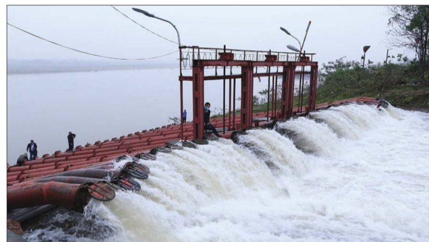
Bom lấy nước từ sông Hồng tại trạm bơm dã chiến Phù Sa (Hà Nội) phục vụ gieo cấy lúa vụ Đông - Xuân 2020-2021