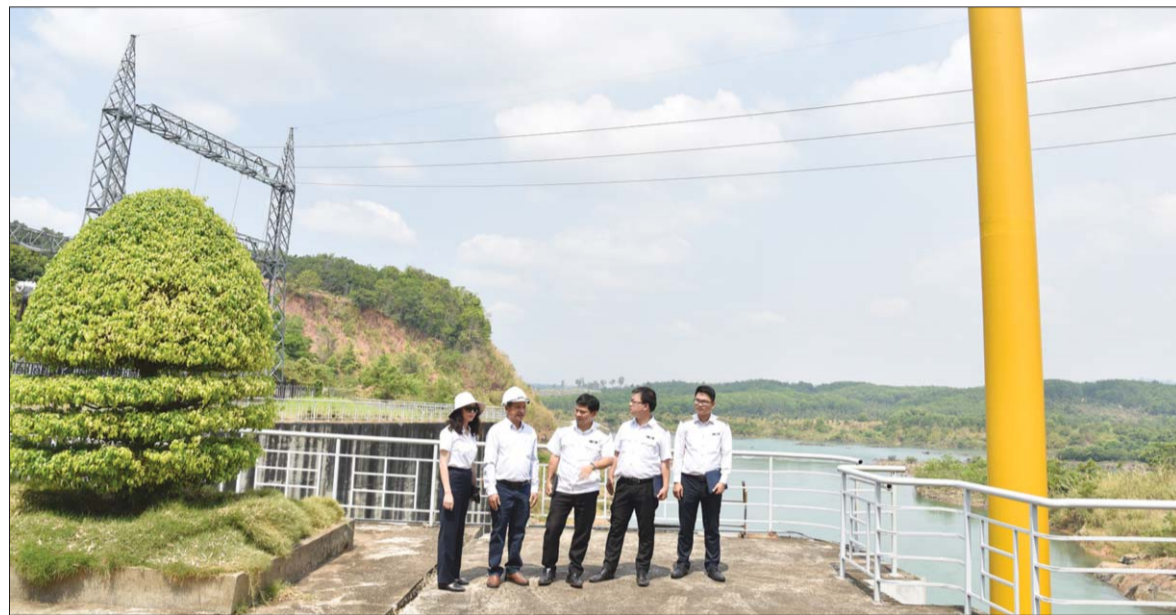
Các đơn vị triển khai kiểm toán trở lại, đảm bảo thích ứng an toàn, quyết tâm hoàn thành nhiệm vụ chung của Ngành

Trong bối cảnh dịch bệnh Covid-19 cơ bản được kiểm soát, các đơn vị kiểm toán của KTNN đang nỗ lực, quyết tâm cao để hoàn thành tốt nhiệm vụ từ nay đến cuối năm; đồng thời tăng cường đào tạo, chuẩn bị điều kiện tốt nhất để triển khai hiệu quả công tác kiểm toán trong thời gian tới.