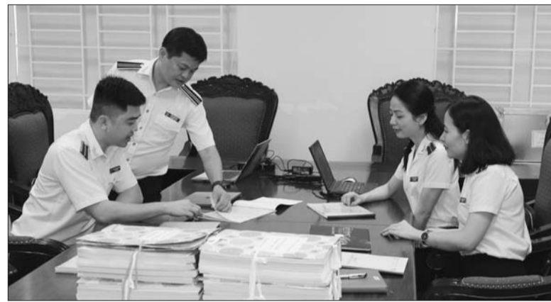
KTNN đã chỉ ra những quy định chưa phù hợp gây mất cân đối trong thu - chi tài chính công đoàn Ảnh tư liệu

Những quy định chưa phù hợp gây mất cân đối trong thu - chi tài chính công đoàn đã dẫn đến nguồn thu tài chính công đoàn lớn, tích lũy cao tại công đoàn cấp trên cơ sở; trong khi đó, tình trạng thiếu kinh phí hoạt động lại diễn ra phổ biến tại các công đoàn cơ sở. Đây là một trong những bất cập lớn được KTNN chỉ ra qua kiểm toán việc quản lý, sử dụng tài chính công, tài sản công của Tổng Liên đoàn Lao động (TLĐLĐ) Việt Nam năm 2019.