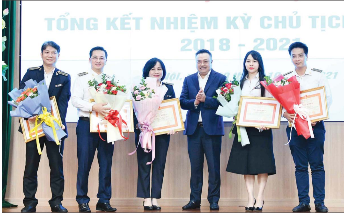
Tổng Kiểm toán Nhà nước Trần Sỹ Thanh trao Bằng khen cho các tập thể của KTNN đã có thành tích xuất sắc, đóng góp cho việc thực hiện thành công vai trò Chủ tịch ASOSAI của KTNN nhiệm kỳ 2018-2021

3 năm đảm nhận vai trò Chủ tịch Tổ chức Các cơ quan Kiểm toán tối cao châu Á (ASOSAI), KTNN đã luôn tiên phong trong việc lãnh đạo, dẫn dắt các cơ quan kiểm toán tối cao (SAI) thành viên thực hiện thành công các chương trình nghị sự quan trọng của ASOSAI với nhiều kết quả nổi bật.