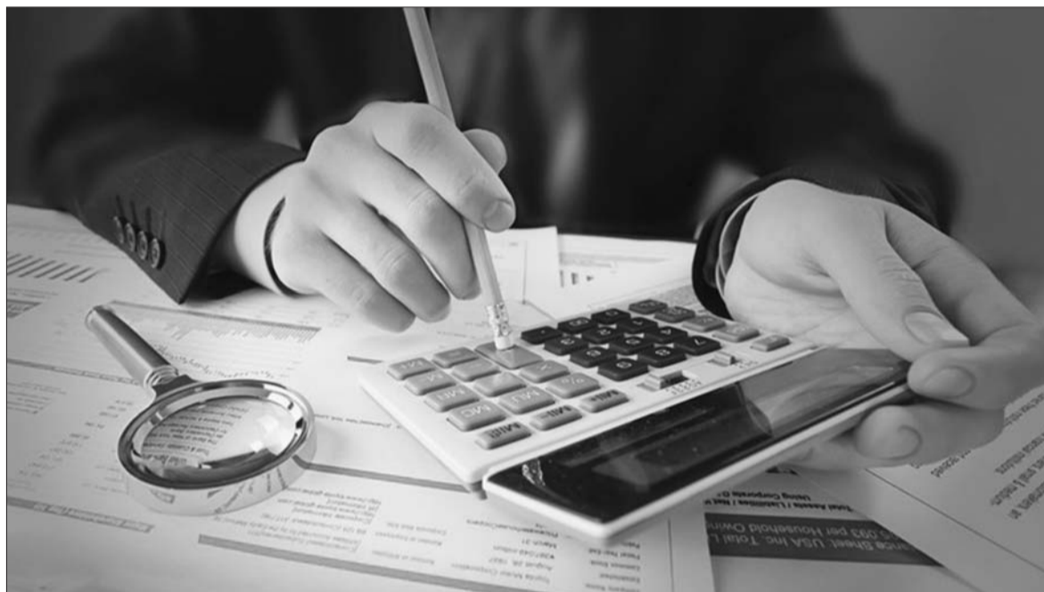
Nhiều thách thức tiếp tục gây áp lực cho chu kỳ kiểm toán năm 2021

Khi đại dịch bắt đầu bùng phát vào đầu năm 2020, chu kỳ kiểm toán năm 2020 đã không còn giống với bất kỳ chu kỳ nào khác trước đó, nhất là khi một loạt các vấn đề về kế toán và báo cáo được đưa lên hàng đầu do chuyển sang làm việc từ xa, các DN đóng cửa, bế tắc trong kinh doanh. Đến nay, mặc dù đại dịch đang dần được kiểm soát nhưng một số ngành vẫn phục hồi chậm, nhiều DN gặp khó khăn, phải hoạt động từ xa khiến một loạt thách thức tiếp tục gây áp lực cho chu kỳ kiểm toán năm 2021.