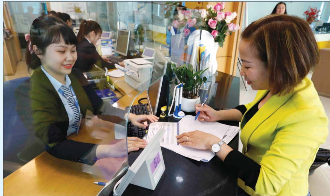
NHNN đã ban hành nhiều văn bản chỉ đạo quyết liệt các TCTD tập trung nguồn lực giảm lãi suất cho vay đối với dư nợ hiện hữu và các khoản vay mới Ảnh tư liệu

Hiện tại, mặt bằng lãi suất huy động và cho vay đều ở mức thấp so với cuối năm 2020. Tuy nhiên, trong điều kiện lạm phát thấp, lãi suất sẽ vẫn giữ ổn định như hiện nay hay tiếp tục giảm thêm để hỗ trợ nền kinh tế phục hồi sau đại dịch? Đó là câu hỏi vẫn đang được nhiều DN quan tâm hiện nay.