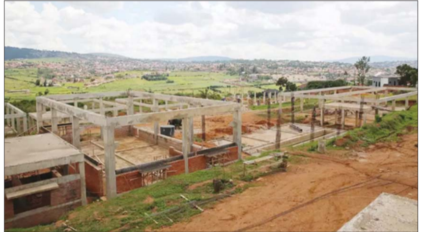
Nhiều dự án đang dở tại Kigali

Công tác quản lý và cải tạo cơ sở hạ tầng, như hệ thống cầu cống, đường xá tại nhiều địa phương cũng bị chỉ trích.